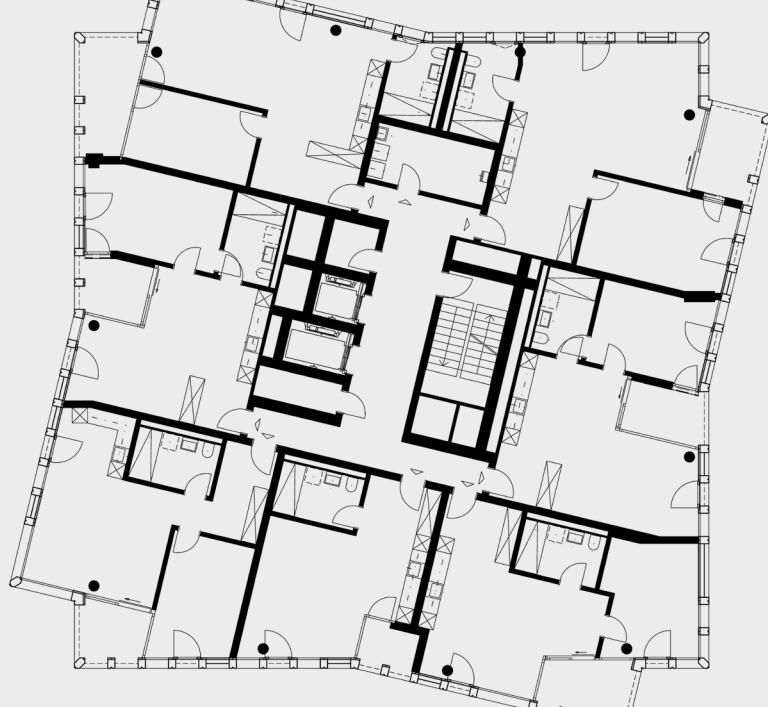
Plano de planta del piso 15