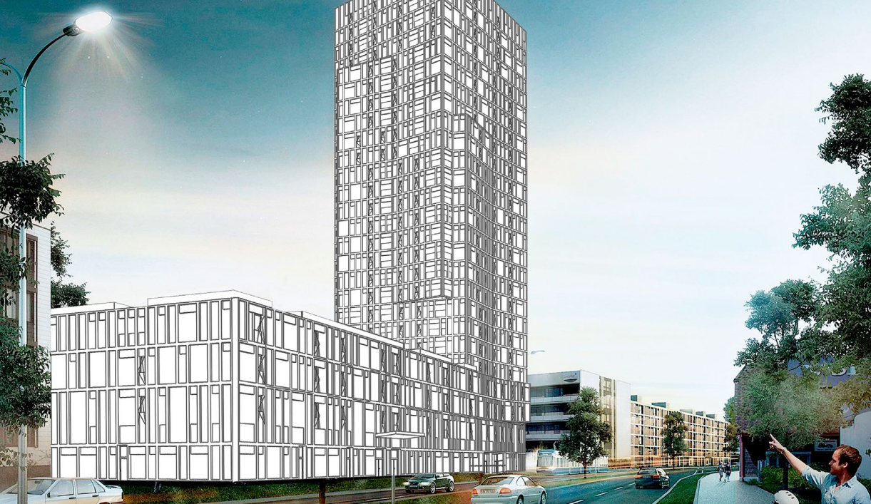
Modelo en 3D de Allplan

para la tercera edad. Se planea ampliar el espacio dedicado a viviendas y locales comerciales con unas 80 viviendas en el terreno de construcción M1.2. Un espacio cultural de uso público completa este gran proyecto. El nuevo barrio se construirá en tres fases. Está previsto que Giessenhof esté terminado en otoño de 2018. La solicitud de construcción de la Torre Giessen se entregará a las autoridades competentes en los próximos meses y se prevé que la obra esté terminada a finales de 2019. Por el momento, el final de la tercera fase está planificado para el otoño de 2021. Este proyecto no solo convencerá desde el punto de vista urbanístico, sino también en términos de sostenibilidad. A ello contribuyen el sello de calidad Credit Suisse greenproperty Gold, la recuperación térmica del río Glatt y la diversidad social esperada en el barrio.